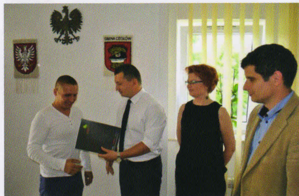
Podpisanie umowy na termomodernizację ZS Piaseczno

W dniu 30 czerwca została zawarta umowa na realizację zadania Termomodernizacja budynku Zespołu Szkolnego w Piasecznie. Wartość zadania wynosi 287 024,19 zł. Docelowo, w ramach zawartej umowy zostanie wykonane ocieplenie ścian zewnętrznych wraz z elewacją, docieplenie stropu, wymiana okien i drzwi, wymiana źródła ciepła na kocioł kondensacyjny i instalacji wewnętrznych c.o. Termin zakończenia prac ma nastąpić najpóźniej do 30 września 2015 r.