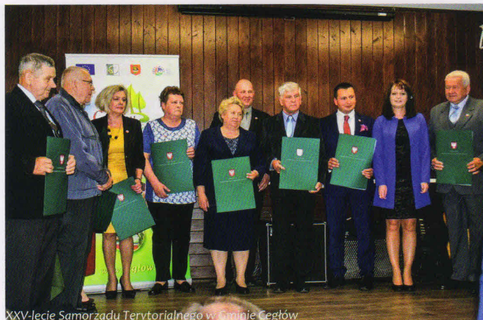
XXV-lecie Samorządu Terytorialnego w Gminie Cegłów

medal „Pro Masovia”. Jest to prestiżowa nagroda dla osób fizycznych lub instytucji, które całokształtem działalności lub realizacją swoich zadań wybitnie przyczyniły się do gospodarczego, kulturalnego lub społecznego rozwoju Mazowsza.