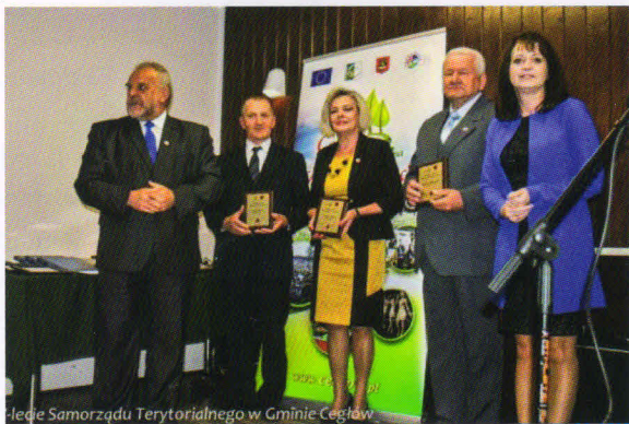
XXV-lecie Samorządu Terytorialnego w Gminie Cegłów